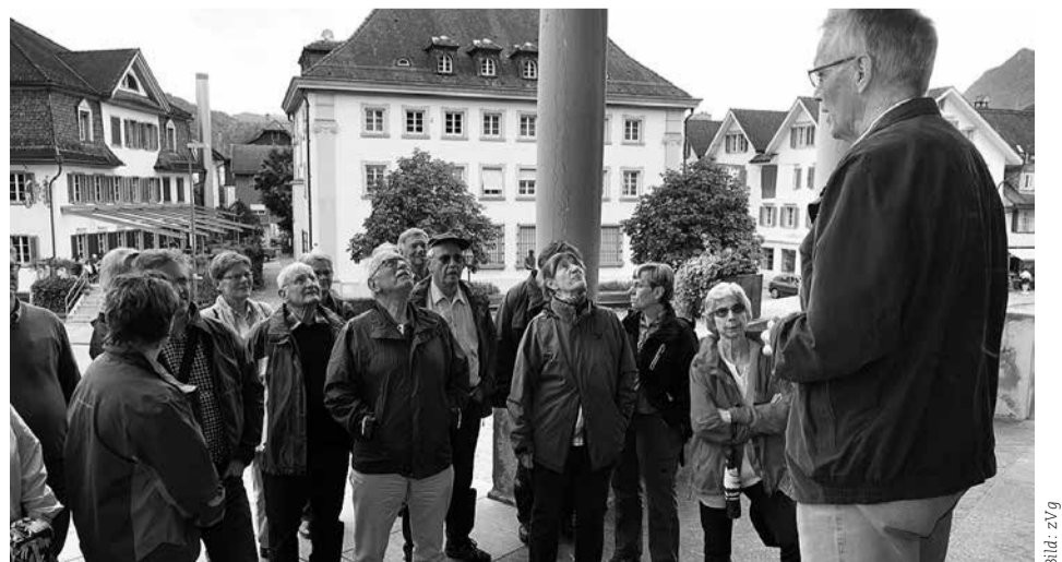
Auf einer Dorfführung verändern sich die Blickwinkel.

Weitere Informationen: www.tourismusstans.ch