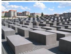
Abb. 1: Telldenkmal, Aaldorf